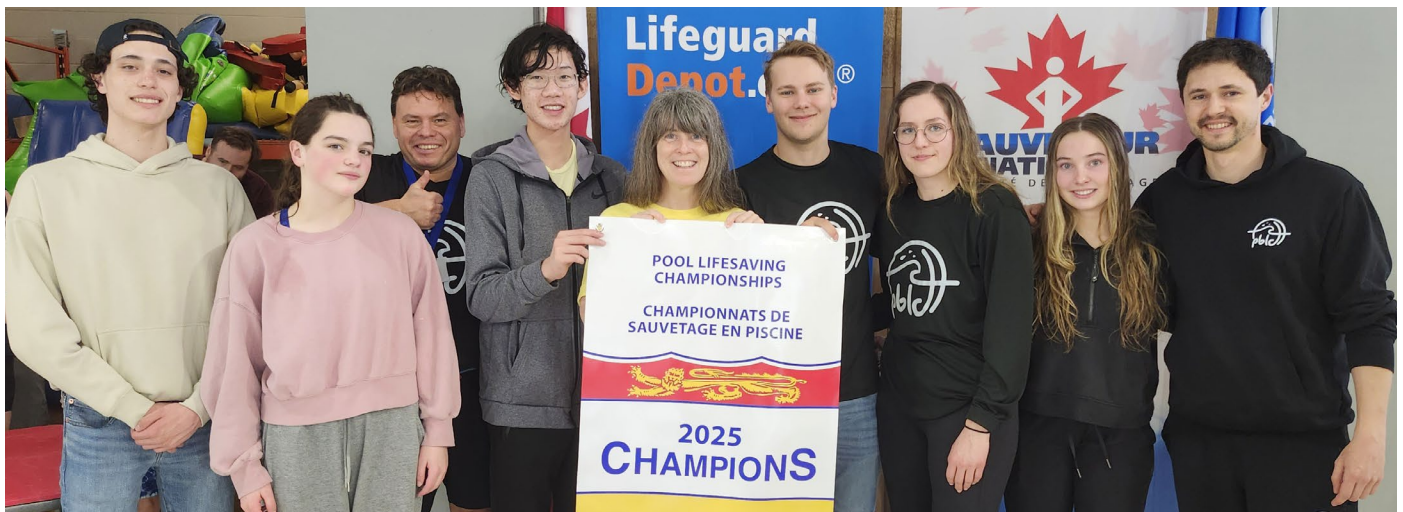
Gagnants de cette année, le Centre aquatique et sportif de Dieppe !

Joyeuses Pâques ! Le bureau de la Société de sauvetage sera fermé le vendredi 18 Avril et le lundi 21 avril pour la fin de semaine de Pâques. Nous rouvrirons le mardi 22 avril à 9 h.